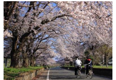
つくば霞ヶ浦りんりんロード