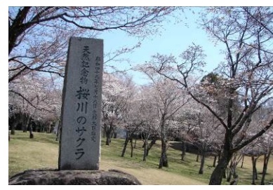
国天然記念物「桜川のサクラ」