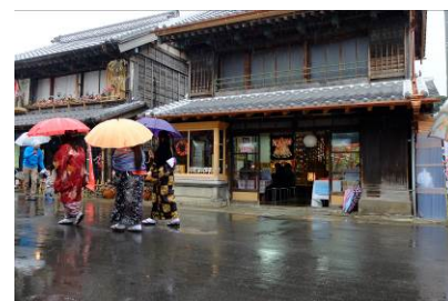
真壁のひなまつり