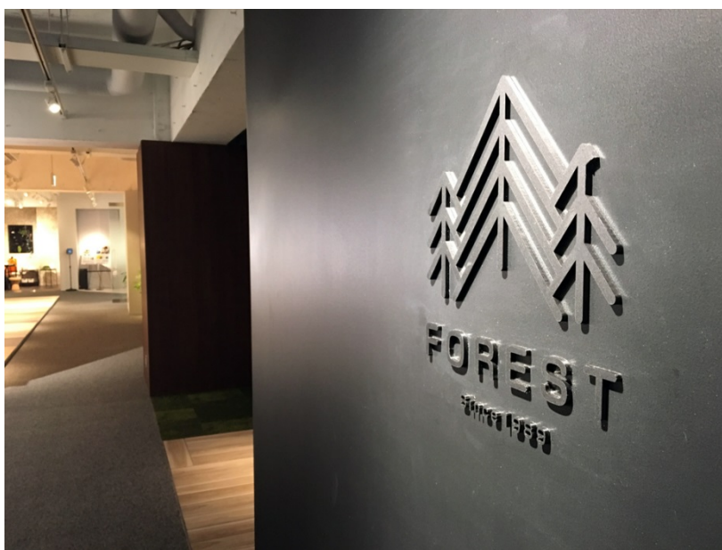
フォレストフェア 2018

今回、世界最高水準の建具用化粧シート「101 エコシート Smart NANO」や、コンクリートの表面に意匠性の高いデザインを付与できる「ベトンフィット™」、表面硬度と耐摩耗性に優れた内装用化粧シート「101 REPREA 高硬度シート」、グロスマット表現により高いデザイン性を実現した「プリント鋼板」など、最新技術を活用した凸版印刷の開発製品を初公開します。