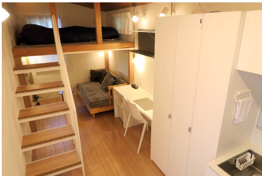
本実証実験で使用する床材と圧力センサーを組み合わせた新製品の構造図(上)と、本製品を設置した実証スペース(下)