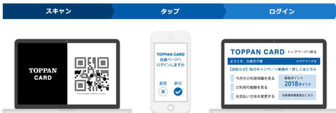
「#NoPasswords」を活用したログインイメージ

本サービスは、2018年10月25日(木)・26日(金)に開催される「FIT2018(金融国際情報技術展)」(会場:東京国際フォーラム)の凸版印刷ブースにてデモンストレーション展示します。また、Trusona 社との共同セミナーも実施します。