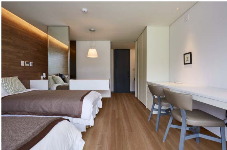
「101 REPREA Smart NANO AREZA」施工イメージ

なお本製品は、2018年11月20日(火)から22日(木)まで凸版印刷が東京にて開催する得意先向けイベント「フォレストフェア 2018 秋」にて紹介します。