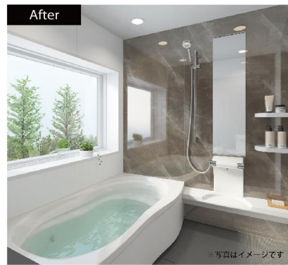
「トッパンリフォームパネル」施工前(左)施工後(右)のイメージ