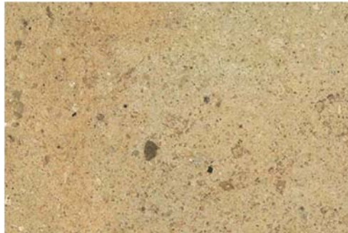
黄龍石(キタツイン)