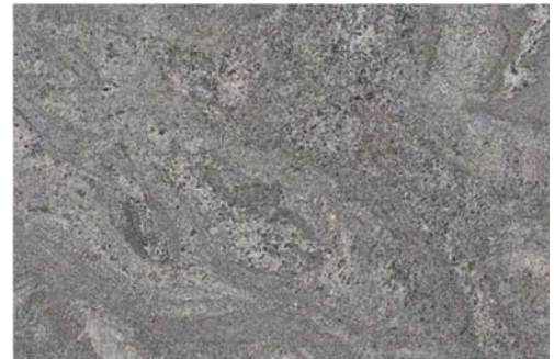
パラディソグラニット