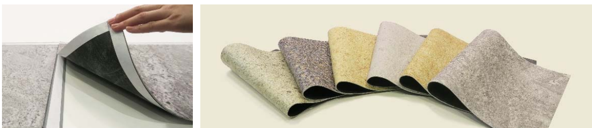
「101ClassArtStone」製品写真