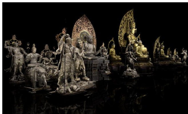
VR作品『空海 祈りの形』 監修:東京国立博物館、真言宗総本山教王護国寺(東寺) 制作:凸版印刷株式会社

凸版印刷は東京国立博物館と共同で東京国立博物館 東洋館内「TNM & TOPPAN ミュージアムシアター」にて、VR作品『空海 祈りの形』(※2)を2019年3月27日(水)より上演しています。本イベントは、VR作品『空海 祈りの形』より立体曼荼羅のみどころを拡大するなどその場でVR映像を操作しながら、空海と最澄の物語を描いた『阿・吽』連載中の漫画家おかざき真里氏と、日本美術ライターの橋本麻里氏の対談を通じて、空海の創造力と魅力に迫るトークイベントです。また、漫画『阿・吽』に見る空海の生き様や作中の数々の印象的な描画表現など、作品づくりに込められたおかざき氏の想いやこだわりについても語りながら、空海とは何者かをひも解きます。