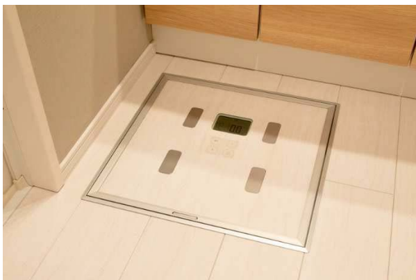
トッパン IoT 建材シリーズ：ステルスヘルスマーター

コスモスイニシアの新築マンション「INITIA」では、洗面化粧台の足元にヘルスマーター置場を用意していますが、『&リノベーション』において、さらなる健康志向の高まりに対応した住まいの開発をめざしており、凸版印刷より新技術の紹介を受け、より手軽に毎日の健康管理ができるよう洗面室床にステルスヘルスマーターを設置しました。取り出す手間なく計測が可能で、日常の邪魔にならないよう操作部の表示・枠材・床材のデザイン改良をすすめ、さらに床下点検口も兼ねた形状を実現しました。今後床との一体性向上や見守りサービスなどの使い方提案を行うなど、凸版印刷の商品化への協力を行う予定です。