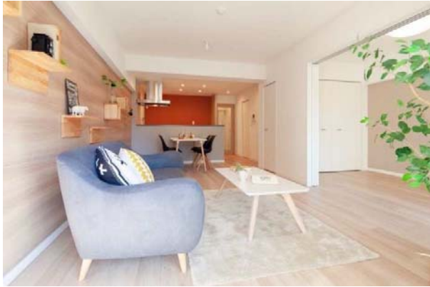
壁面マグネットパネルシステム

パネルに取り付けた棚板はお住まいの方が自由に移動することができるため、暮らし方に合わせてアート、写真、小物の飾り棚などさまざまな用途に使用できます。キャットウォークや本棚としても利用可能です。表面材は豊富な色柄のある101エコシートのため、床のフローリングや建具とも統一感を演出できます。また、棚を設置していない状態でもアクセントウォールとなります。