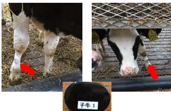
子牛への「MEDiTAG」装着の様子

本実証実験において凸版印刷は ID-Watchy Bio の提供及びシステム開発、ホシデンは生体センサー MEDiTAG の提供及び家畜向けシステム開発、日本全薬工業は実証フィールドの提供・データ分析を行います。