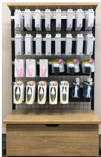
「スマートシェルフ」全体イメージ

なお本サービスは、2019年9月11日(水)から13日(金)まで開催される「第21回 自動認識総合展」(会場:東京ビッグサイト)の凸版印刷ブース(南ホール 4F・A-84)にて展示します。