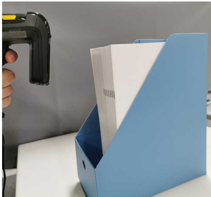
書類管理読み取りイメージ

UHF帯のICタグは複数のICタグを一括で読み取れるという特徴を持っています。しかし至近距離で重ねると読み取ることができず、一定の間隔を保持する必要がありました。このような課題に対し今回開発した「書類管理向けモデル」は、2mm～3mmという極めて狭い間隔で重ねても読み取ることが可能です。これにより、紙やクリアファイルにICタグを装着しても一括で読み取ることが可能となるため、書類や資料の管理をICタグで行うことにより、業務効率化・省人化に貢献します。