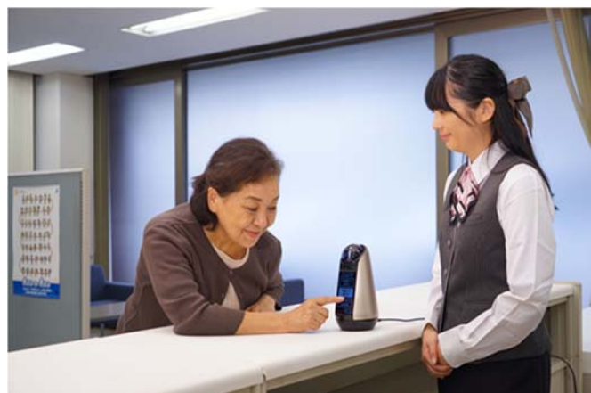
(左)ソニーモバイルコミュニケーションズ株式会社「Xperia Hello!」活用によるサービスイメージ (右)利用イメージ