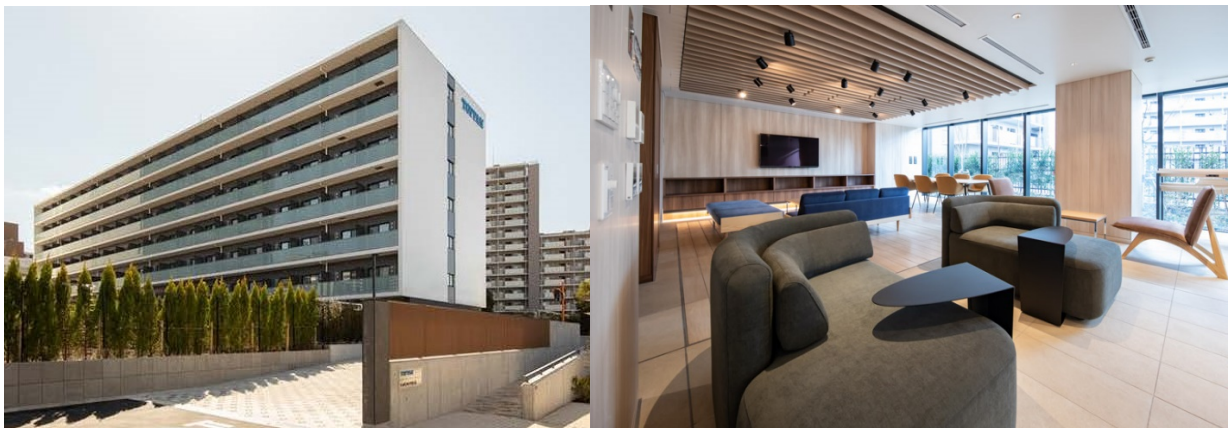
(左)「トッパンハイツ東十条」の外観 (右)落ち着いた印象の共用ラウンジ

「トッパンハイツ東十条」では、天気や時刻などの最新情報を表示する「インフォウォール」や、電源のオン/オフで透明/不透明が瞬時に切り替わる液晶調光フィルム「LC MAGIC」など、凸版印刷の最新住居用商材を導入。次世代型住空間において快適に日々の生活を過ごすことで、若手社員のエンゲージメントが高まることを期待しています。あわせて、防音効果を施したシアタールームや共用ラウンジも設置し、入居者同士のコミュニケーションを図る環境を整えました。