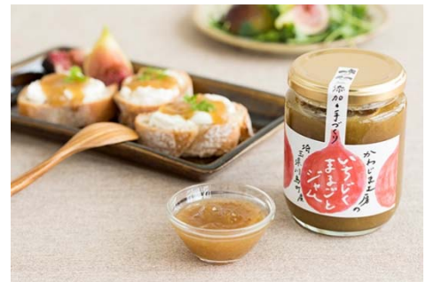
パッケージのデザインを改良した「いちじくジャム」

「川島カレー」や「いちじくジャム」など「KJ(かわじま)ブランド」(※2)のブランド力向上のため、専門家による商品パッケージのデザイン改良やテストマーケティングの支援・消費者調査、販売促進のためのツール開発など特産品の磨き上げ支援を実施しました。