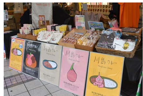
首都圏で開催されたイベントの様子

川島町の魅力を広く発信し交流人口を拡大することを目的に、首都圏において 2018 年、2019 年物産展やマルシェなどのイベントを実施し、「KJ ブランド」の認知拡大を図りました。イベントには町内の事業者や地域住民も参加し、首都圏の消費者へ町の魅力を体感する機会を提供しました。