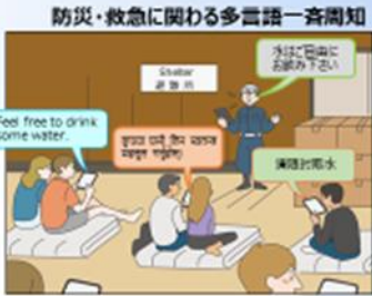
防災・救急に関わる多言語一斉周知