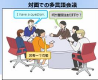
対面での多言語会議