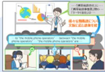
セミナー・国際展示等における講演