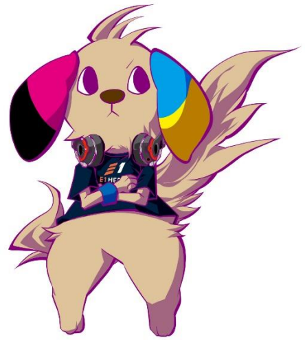
E1 HEROES 公式キャラクター「いーわん君」

* 本ニュースリリースに記載された商品・サービス名は各社の商標または登録商標です。