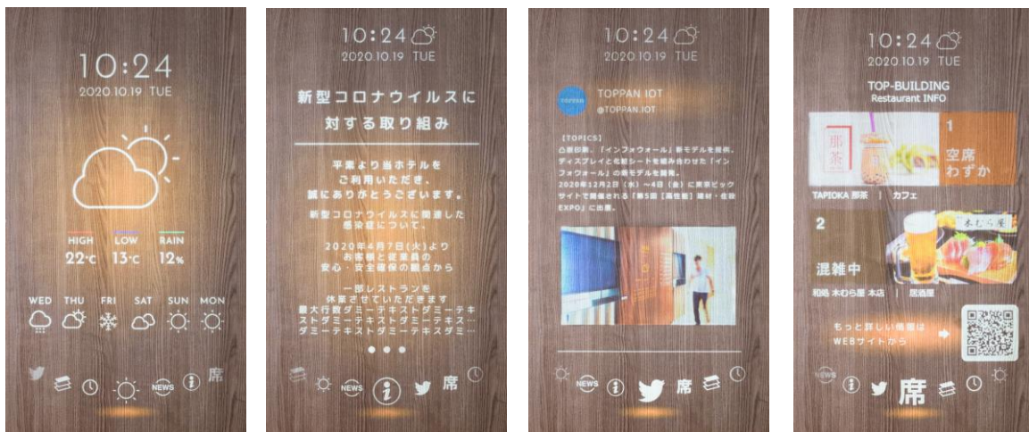
「インフォウォール®」新モデルの表示イメージ

この「インフォウォール®」新モデルは2020年12月2日(水)から4日(金)に東京ビックサイトで開催される「第5回[高性能]建材・住設 EXPO 2020」に出展します。