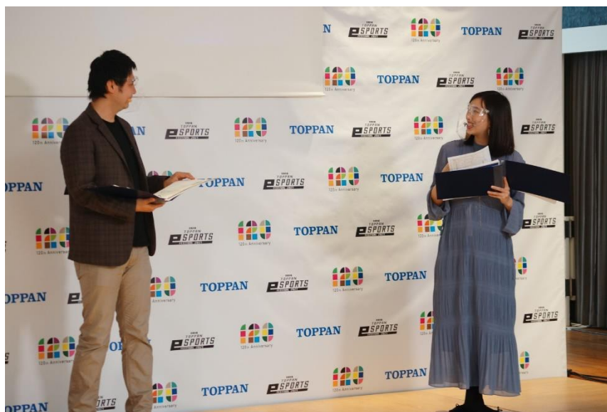
大会の様子

本イベントのテーマ「つながろう」に合わせて、国内 16 拠点、海外 13 拠点、計 29 拠点から事前に集めた動画メッセージをコンテンツの合間にリレー形式で紹介しました。