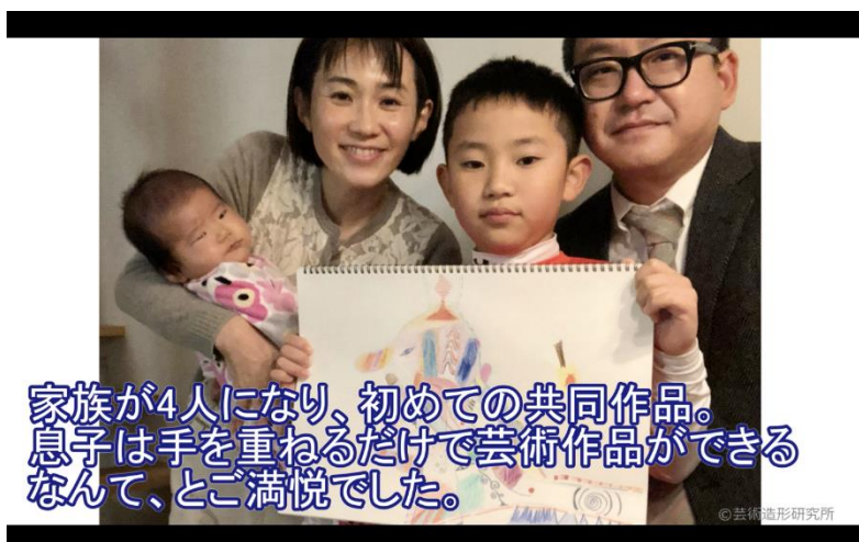
アートギャラリー「HAND IN HAND」の様子

トッパンのグループ会社である株式会社芸術造形研究所が、2020年12月末に家族で参加できるオンラインアートセッションを実施。そこで描かれた作品やアートセッションを楽しむ参加者の様子を映像化し「HAND IN HAND」と題して、TOPPAN eSPORTS FESTIVAL 2021 当日に番組内で公開しました。