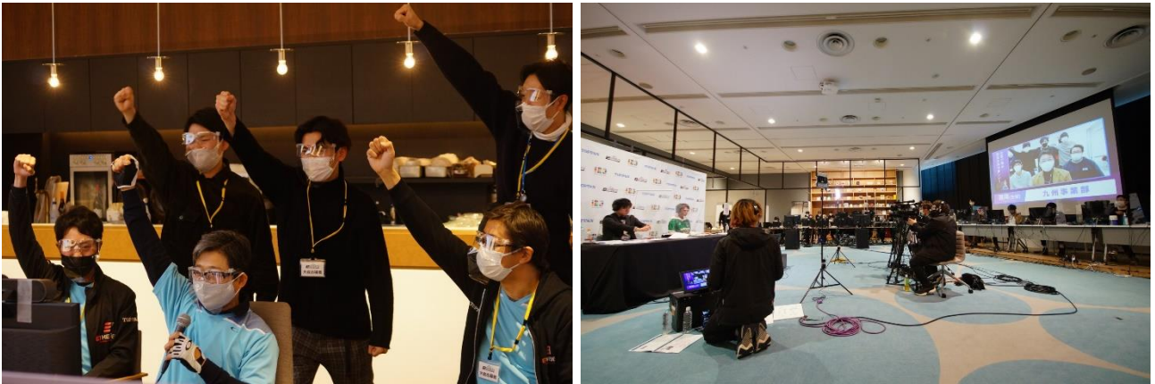
トーナメント戦の様子

「eFootball ウイニングイレブン 2021 SEASON UPDATE」