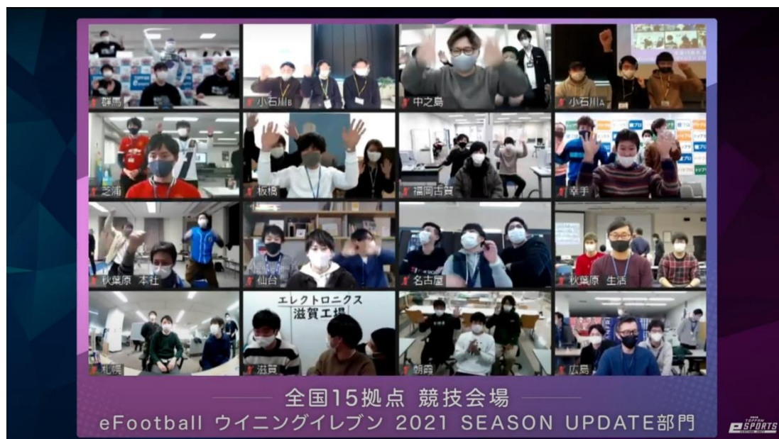
大会の様子