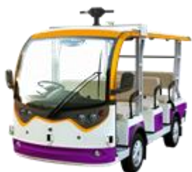
8 人乗り自動運転低速 EV カート

平城宮跡歴史公園の交通ターミナルを約 5 分間で周回する自動運転低速 EV カート車内に AI コンダクターを搭載します。手を車両から外に出したり、マスクを外して乗車した場合、車内映像をもとに AI コンダクターが注意アナウンスを行います。また、参加者と対話し、参加者の関心に合った解説や案内を行います。車内の映像や音声をローカル 5G で低遅延で伝送するため、自然なアナウンスや対話を行うことができます。これにより、安全・安心かつ新たな関心を引き起こす移動体験を実現します。