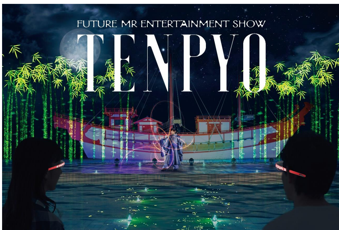
リアルな復原遣唐使船と演者に CG 演出を重ね合わせた MR 体験

平城宮跡歴史公園内の屋外の「復原遣唐使船」を舞台に、ダンサーのパフォーマンスに MR グラスに表示させた CG 演出効果を重ね合わせることで舞台風歴史体験を実現します。複数の参加者の MR グラスからの情報収集や映像コンテンツの配信に低遅延のローカル 5G を活用することで、参加者の位置や移動に合わせた映像表示や、手の動きなどのジェスチャーに合わせた演出映像の参加者全員の共有などを楽しむことができます。これにより、通常の史跡見学では味わうことのできない、歴史空間に仲間と一緒に入り込む新たな歴史観光体験を実現します。