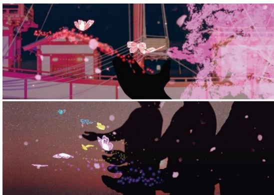
ジェスチャーによる共有体験