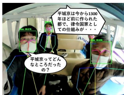
AI コンダクターとの対話