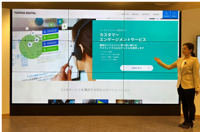
「180 インチマルチディスプレイ」

4K に対応した大型ディスプレイを常設。ウェビナーの開催やプレゼンのオンライン配信、新商品発表など、様々な用途にお使いいただくことを想定しています。