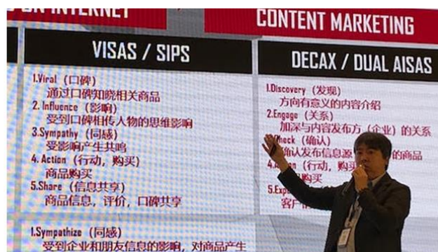
2019 年開催の AIPIA Asia Summit での展示ブース(左)と凸版印刷社員による講演の様子(右)