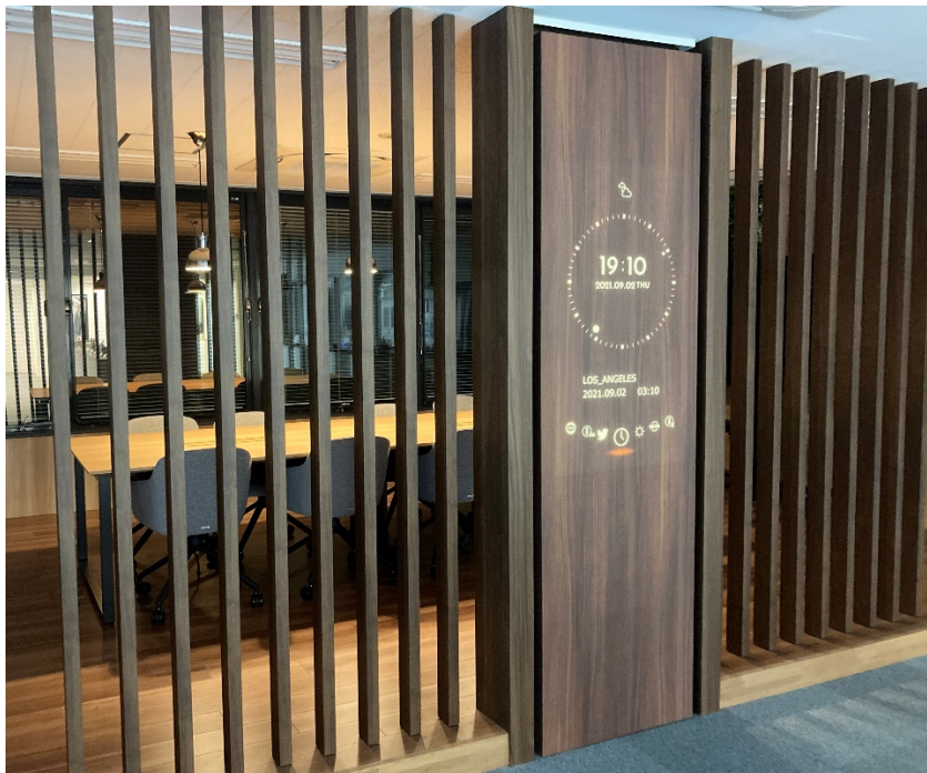
「インフォウォール®」

ディスプレイと化粧シートを組み合わせることで空間デザインを損なわず、生活に役立つ情報を表示する壁面デジタルサイネージです。