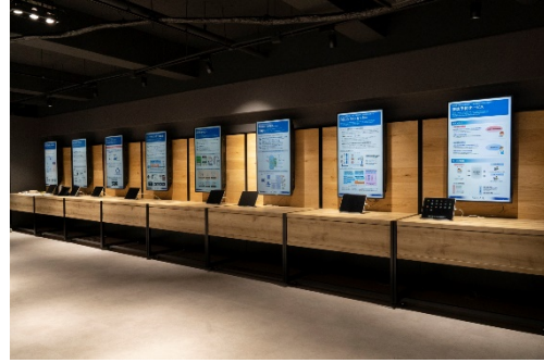
「セミナーゾーン(左)、縦型サイネージ(右)」