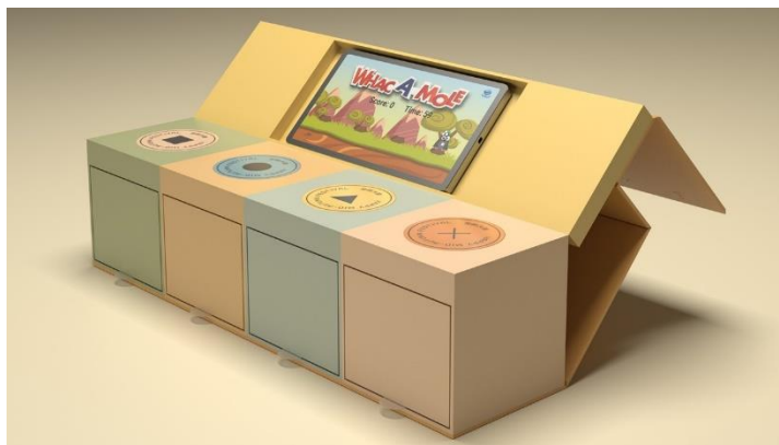
NFC でスマートフォンとつながるインタラクティブパッケージ

パッド型スイッチを指で押す、叩くといったアクションと、スマートフォンの画面表示や音声連動し、インタラクティブな体験を楽しむことができます。また、パッケージに搭載された LED をバッテリー無しでスマートフォンからの給電により点灯させることや、ID 認証システムとの連携でセキュリティ機能を持たせることも可能です。