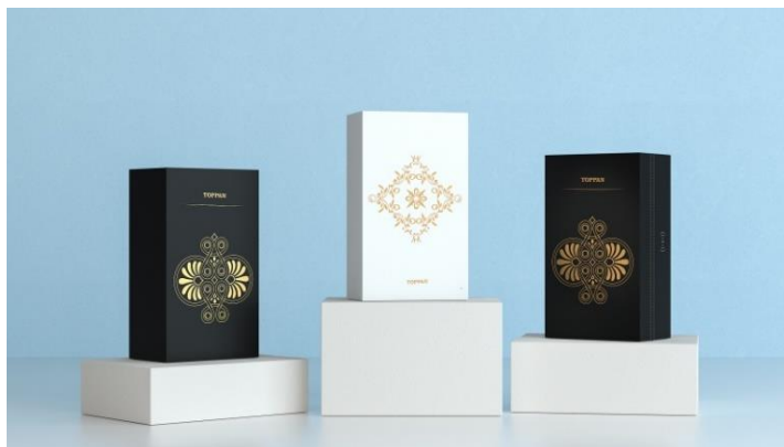
NFC 機能内蔵型スマートパッケージ

不正防止に有効な手段として、脆い構造の NFC 通信用回路をパッケージに組み込んでいます。従来の NFC ラベルをパッケージの表面に貼り付ける方法に比べて高いセキュリティを実現するとともに、NFC タグの貼り付け作業の負担を軽減することができます。