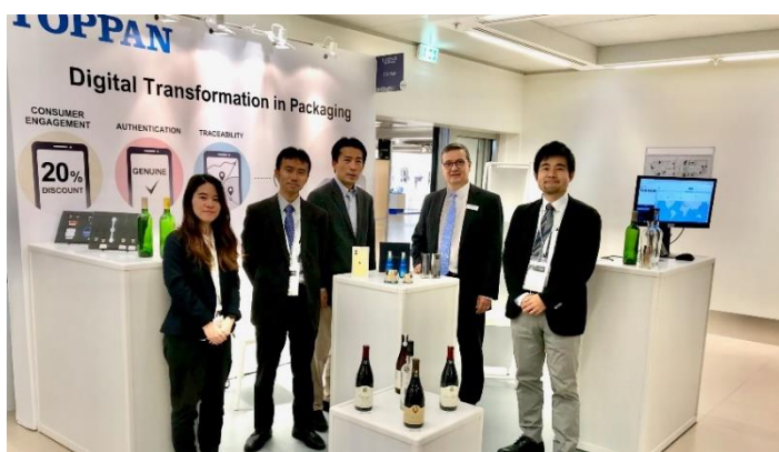
Luxe Pack Monaco 2019 出展時のトッパンブースの様子

会期中、トッパンブースでは、トッパンヨーロッパの社員が製品・ソリューションを紹介するライブイベントを行います。トッパンブースの出展内容については こちら(英語) でご案内します。