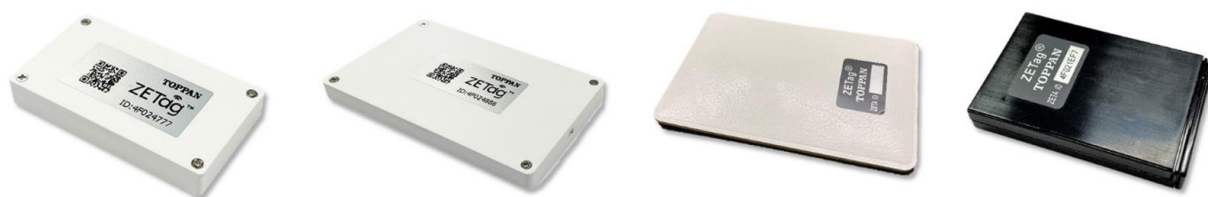
「ZETag®」ラインナップ 左から ZETag®標準版、ZETag® RFID 搭載版、ZETag®薄型版、ZETag® GPS 搭載版