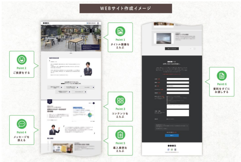
「SALAD-BAR®」を使った WEB サイト作成イメージ

企業に対してオリジナルの提案用 Web サイトを構築することが可能です。企業毎に提案したい商材/メッセージを変えて届けることができるので、効果的な営業活動を実現します。同時に、営業担当者のメッセージや顔写真も追加可能なので、特別感のある提案を演出することもできます。