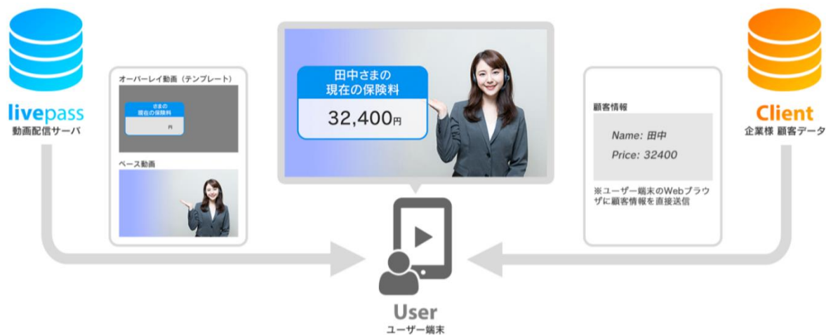
パーソナライズ動画機能の利用イメージ