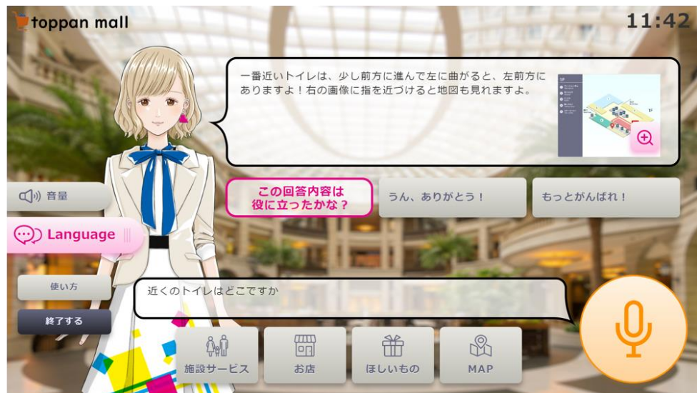
BotFriends Vision のサービスイメージ