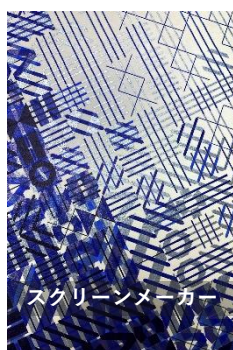
スクリーンメーカー

今年のグラフィックトライアルでは、作品制作の中で数多くの新しい表現技術が試され、そして誕生しました。網点の形を変える「スクリーンメーカー」をはじめ、オフセット印刷でホログラムを再現した「オフセットホロ」、繊細な水滴を印刷で再現した「結露印刷」など、多彩な印刷表現をご覧ください。