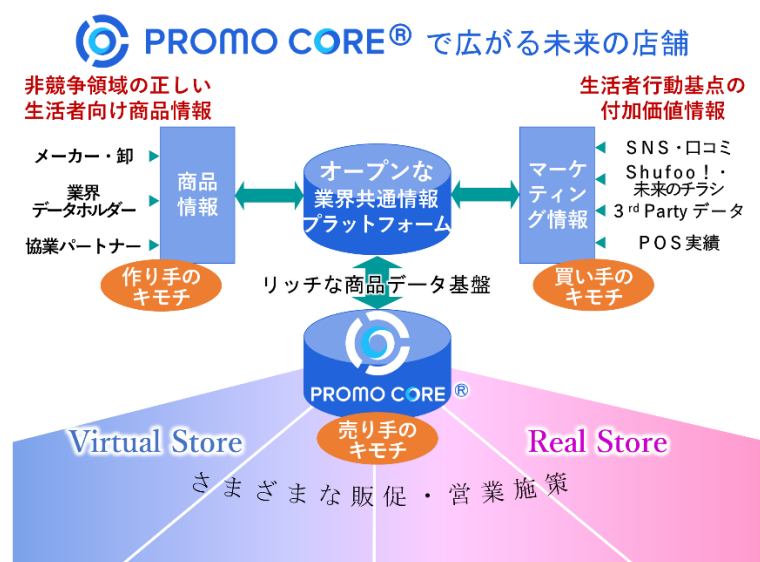
「PROMO CORE®」サービスイメージ