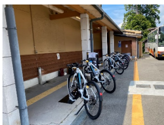
高野山駅前ステーション