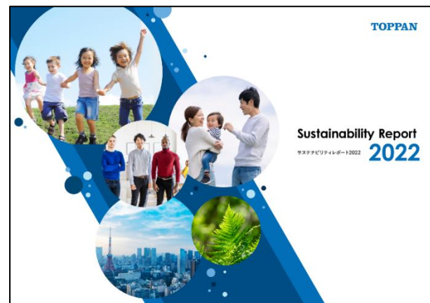
「サステナビリティレポート 2022」(※2)

(※1) https://www.toppan.co.jp/ir/material/annual.html