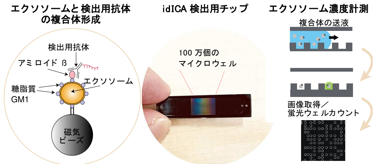
エクソソームのデジタル計測 idICA(図 1)

今回、湯山研究グループと凸版印刷がエクソソームを検出した高感度センシング技術は、計測チップ上の 100 万個のマイクロメートルサイズの微小なウェルに標的となる分子や粒子を確率的に 1 個ずつ閉じ込めて、分子や粒子から発する信号の有り「1」、無し「0」から標的をデジタル検出・定量する手法です。凸版印刷の独自技術である高感度蛍光検出技術「Digital ICA ® 」を採用し、血液中にわずかにしか存在しない脳組織から漏れ出たアミロイド β が結合し糖脂質 GM1(※5)を含有するエクソソームを検出することに成功しました(図 1)。