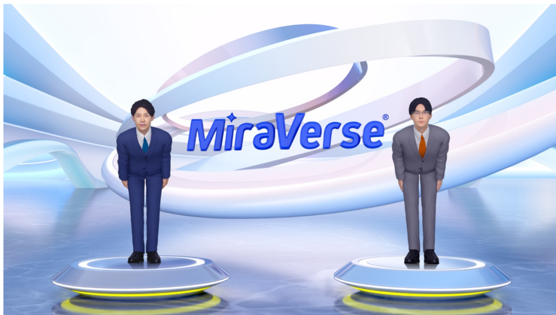
CMシリーズ最新作『すべてを突破する。TOPPA!!!TOPPAN メタバース篇』より

CM放映と連動して、BS-TBSで凸版印刷提供による特別番組「メタバース ビジネスの芽を探せ」を10月16日(日)に放映します。