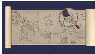
虫眼鏡で拡大している様子