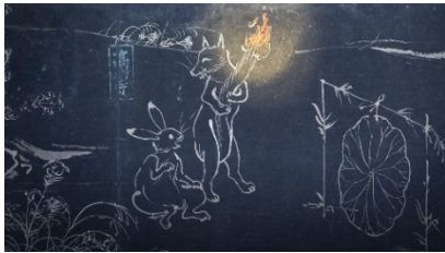
アニメーションシーン

来場者に配布するミュージアムシアターオリジナルうちわを使用し、甲巻にまつわるクイズを出題します。世代を問わず、鳥獣戯画を初めて見る方も楽しむことができる内容になっています。