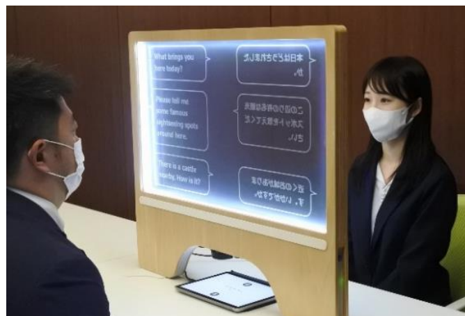
窓口業務のユニバーサルコミュニケーションを支援する「VoiceBiz® UC Display」

住民サービスの向上に向けた職員のノンコア業務への負荷軽減や、受付窓口におけるユニバーサルコミュニケーションを支援した事例などを紹介。ICTの活用によって高セキュリティかつ効率的な公共業務を支援しています。