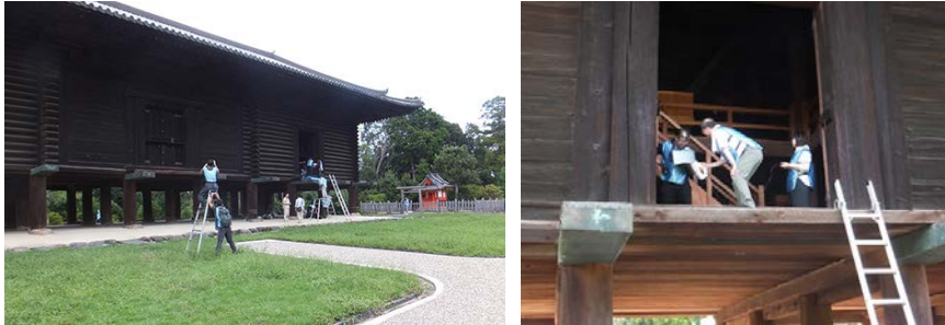
「正倉」の(左)扉の計測と(右)壁面の撮影の様子 協力:宮内庁正倉院事務所

本作品の製作にあたり、TOPPAN は正倉院事務所の協力を得て、「正倉」の外観・内部と「螺鈿紫檀五絃琵琶」を対象として、立体形状計測と高精細撮影によりデジタルアーカイブを実施。取得したアーカイブデータを活用し、「正倉」と正倉院宝物「螺鈿紫檀五絃琵琶」を VR で精密に再現しました。通常立ち入ることができない「正倉」の内部空間や、世界で唯一現存する五絃琵琶である「螺鈿紫檀五絃琵琶」の緻密な装飾など、普段は見る機会が限られた建築や宝物の鑑賞を可能にしました。