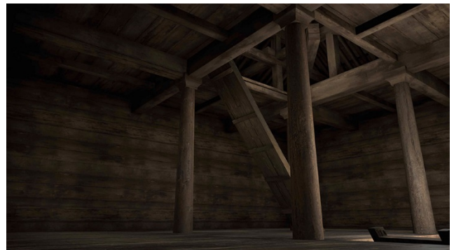
(左)「正倉」の構造と(右)VR 正倉内部。総檜造りの質感までわかる。