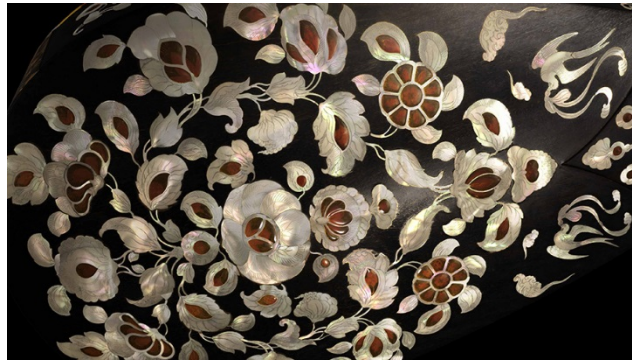
表面に施された緻密な装飾