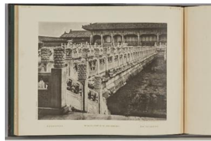
『清国北京皇城写真帖』