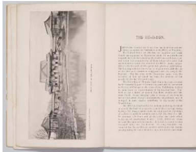
『ILLUSTRATED DESCRIPTION OF THE HO-O-DEN (PHOENIX HALL)』

1904年に始まった日露戦争でも、戦況を伝え、戦果を喧伝する、数多くの視覚情報を伴った印刷物が出版されました。それらは、国内向けだけではなく、世界に日本の力を誇示するために和英併記されたものもありました。