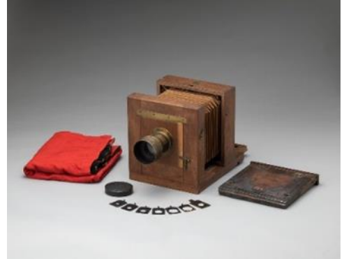
暗箱(明治初期、行田市郷土博物館蔵)

ちょうどその頃、武蔵野国忍城下(埼玉県行田市)で、原田朝之助(後の小川一眞[おがわかずまさ]、1860～1829年)が誕生します。10代で上京した際、写真術を知り、興味をもった小川一眞は、コロディオン湿板法を身に付け、富岡町(群馬県富岡市)で写真業を始めました。コロディオン湿板法が全国に広まり、印刷も新旧の様々な技法が林立した明治時代前期において、写真は写真、印刷は印刷で完結しており、それらはまだ結びついてはいませんでした。