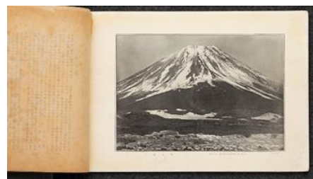
H.G.ボンディング撮影『富士山』