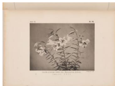
『大日本植物志』第一卷第二集より「さくゆり」