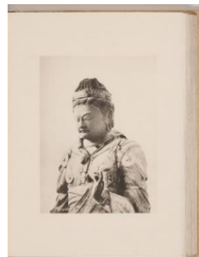
『Histoire de l'art du Japon』