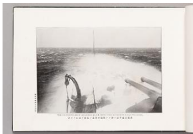
海軍省認可『日露戦役海軍写真帖 全』