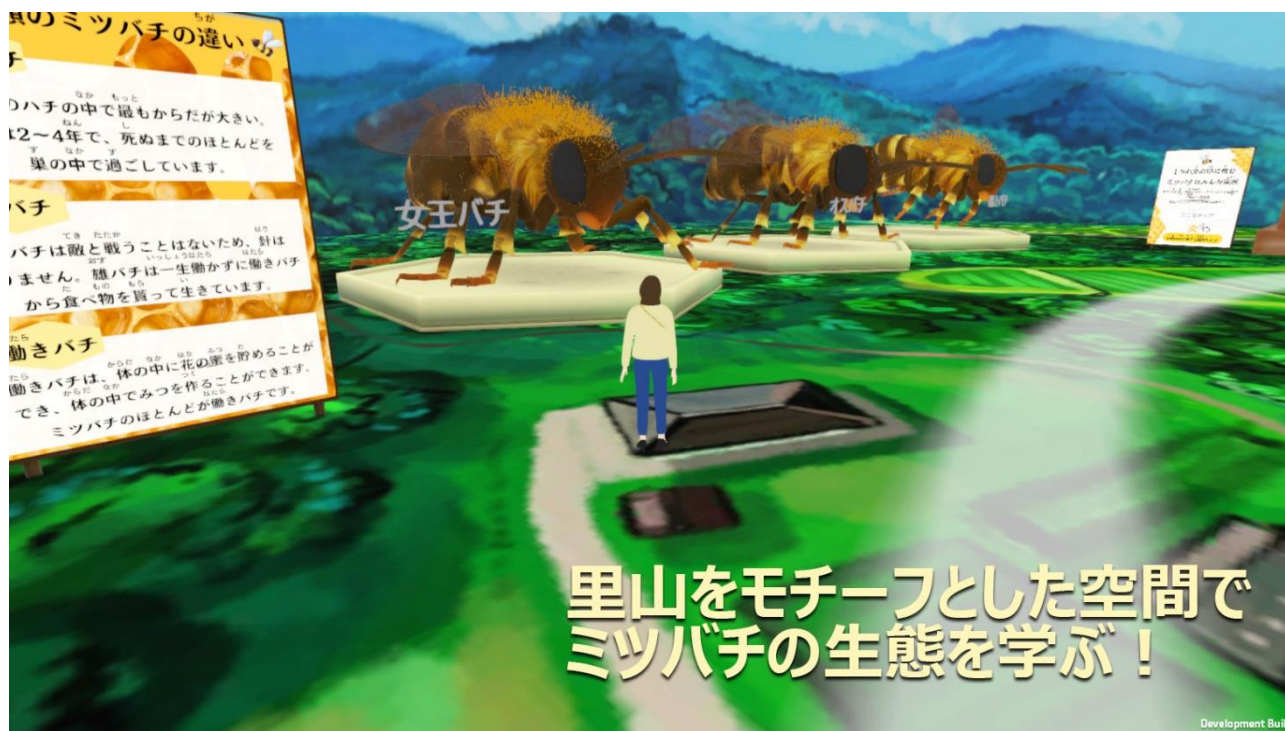
「メタパ里山ワールド・ミツバチ編」

このたび、本提携の一環で、メタバースを活用した、自然環境への興味/関心の対象を広げる知育コンテンツ「メタバース動物園」を共同で開発。その第一弾として、2024年3月29日(金)～31日(日)に開催される「AKASAKA あそび！学び！フェスタ」(会場:赤坂サカス広場、TBS赤坂BLITZスタジオ)内で、ミツバチの生態を学ぶことができる「メタパ里山ワールド・ミツバチ編」を公開します。