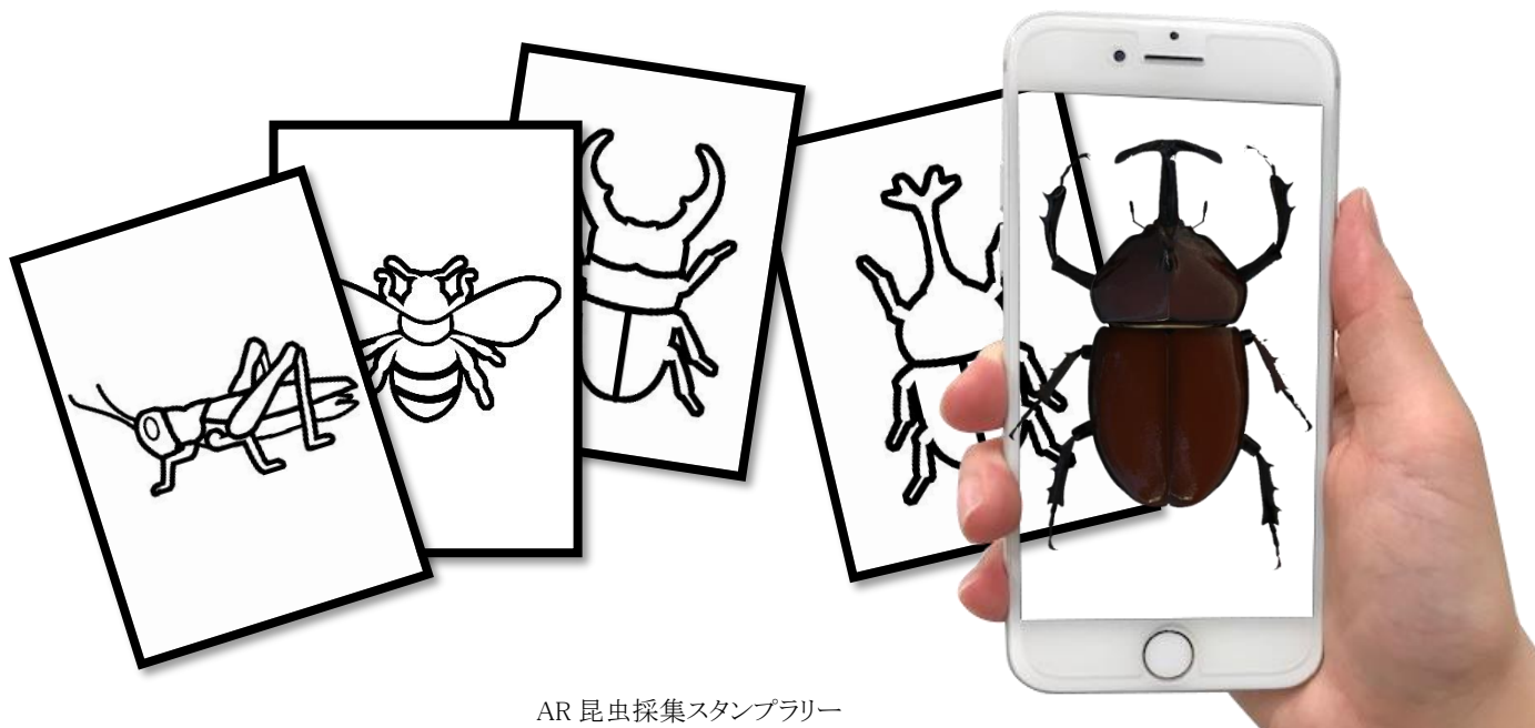
AR 昆虫採集スタンプラリー

参加者が会場内に設置された AR マーカーを、体験型 XR 観光アプリ「ストリートミュージアム®」(※1)で読み取ることで、アプリ上に CG でリアルに再現された昆虫が表示。スタンプとして収集できます。