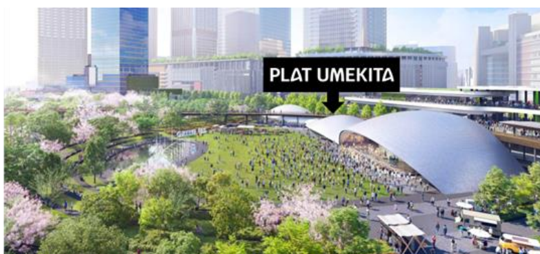
うめきた公園と大屋根施設

本施設はうめきた公園内「大屋根施設」の中心に位置する仕切りのないオープンスペースで、以下の3つのゾーンで構成されます。