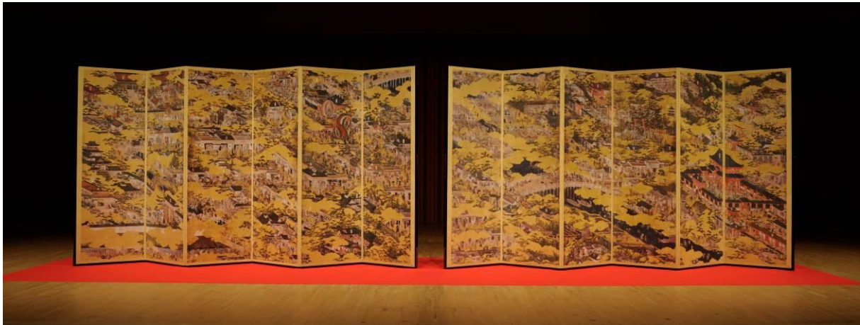
国宝「洛中洛外図屏風(舟木本)」の高品位複製 監修: 東京国立博物館 制作: TOPPAN 株式会社

本VR作品製作時に取得した 22 億 1000 万画素にも及ぶ膨大なデジタルアーカイブデータを活用し、TOPPAN のデジタル画像処理技術と高品位印刷「プリマグラフィー®」を用いて東京国立博物館の監修を受け制作した原寸大の複製です。同作品の精緻に描かれた極めて小さな人物の細部まで再現するとともに、経年変化で損なわれた色彩を、実物の雰囲気や壊すことなく復元しました。屏風の至近距離での鑑賞を可能とし、細密に描かれた京都の町に生活する人々の姿が、よりいっそう輝きを増し、生き生きと感じられます。