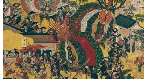
(左) 夜桜の下で「洛中洛外図屏風(舟木本)」を楽しむ (右) 高密度に描き込まれた祇園祭の風景を超拡大 VR 作品『洛中洛外図屏風 舟木本』より 監修: 東京国立博物館 制作: TOPPAN 株式会社