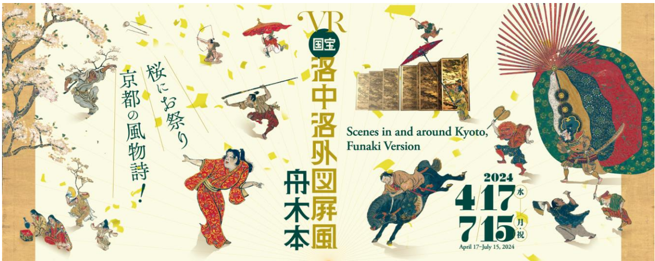
VR作品『洛中洛外図屏風 舟木本』 監修:東京国立博物館 制作:TOPPAN 株式会社