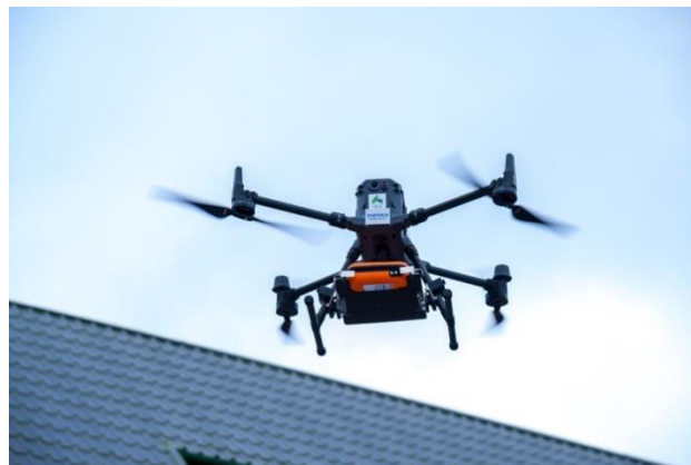
本実証実験の様子