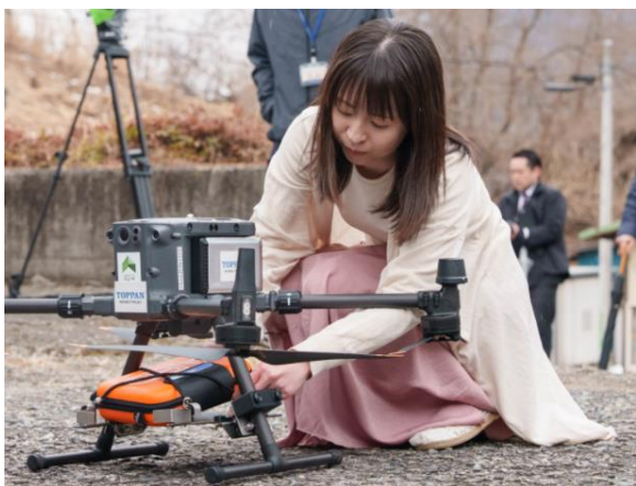
救助者が AED を受け取る様子(デモンストレーション)